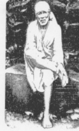
ಶ್ರೀ ವರಹದ್ವಿ ವಿಷಯಕಾಯ ಸಮಃ ಪ್ರಾಣಕಾಲದ ಕಾಕಡಾರ್ಕ ಉಪಾಸನಾ ಕ್ರಮವು

ಶ್ರೀ ಸಚ್ಚಿದಾನಂದ ಸದ್ಗುರು ಸಾಯಿನಾಥ್ ಮಹರಾಜ್ ಕೀ ಜೈ