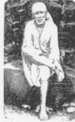
ರಾಜ, ಆರತಿ (ತೇಜಾರತಿ) ಉಪಾಸನಾ ಕ್ರಮವು ಶ್ರೀ ಸಚ್ಚಿದಾನಂದ ಸದ್ಗುರು ಸಾಯಿನಾಥ ಮಹಾರಾಜ ಕೇ ಜೈ|

ಓಂ ರಾಜಾಧಿರಾಜ ಯೋಗಿರಾಜ ಪರಬ್ರಹ್ಮ ಶ್ರೀ ಸಚ್ಚಿದಾನಂದ ಸದ್ಗುರು ಸಾಯಿನಾಥ ಮಹಾರಾಜಕೇ - ಜೈ.