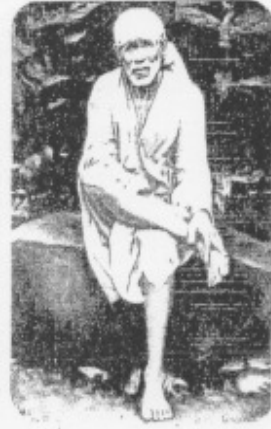
ಸಾಯಂಕಾಲದ ಅರತಿಯ ಉಪಾಸನಾ ಕ್ರಮವು

ಶ್ರೀ ಸಚ್ಚಿದಾನಂದ ಸದ್ಗುರು ಸಾಯಿನಾಥ ಮಹಾರಾಜ ಹೀ ಭೈ |