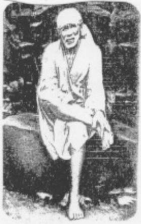
ಮಧ್ಯಾಹ್ನದ ಆರತಿ ಉಪಾಸನಾ ಕ್ರಮವು (12 ಘಂಟೆಗೆ)